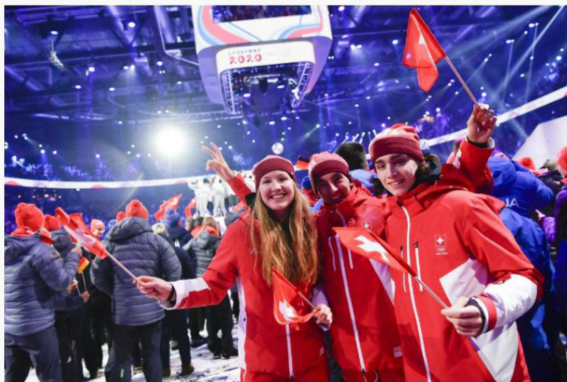
Opening Day Youth Olympic Games Lausanne 2020

Performances sportives de pointe, nombreux spectateurs et spectatrices enthousiastes, respect des valeurs olympiques : Les Jeux Olympiques de la Jeunesse Lausanne 2020 ont été un parfait succès sur tous les plans. La Suisse a pu fêter 24 médailles décrochées à Lausanne par ses athlètes, pour qui les expériences acquises dans le cadre d'un événement d'une telle envergure revêtent autant d'importance que les succès remportés.