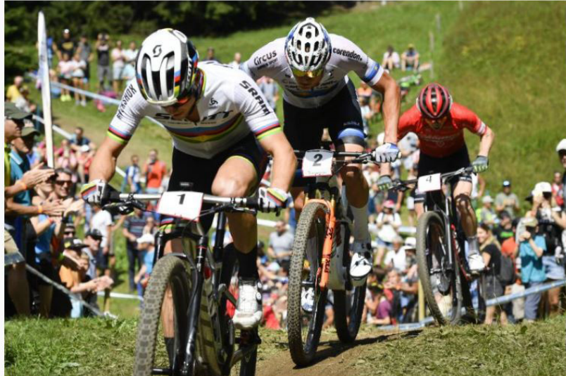
Nino Schurter et Mathias Flückiger, VTT Coupe du monde 2019 Lenzerheide

En Suisse, de nombreuses manifestations sportives internationales importantes de différentes tailles ont lieu chaque année sous des formes diverses. Ces manifestations ont de multiples effets sur le sport, l'économie et la société, et marquent de leur empreinte l'image de la Suisse et du sport suisse. L'établissement d'une stratégie s'y rapportant doit, à l'avenir, contribuer de manière ciblée à la promotion du sport de performance et de masse en Suisse.