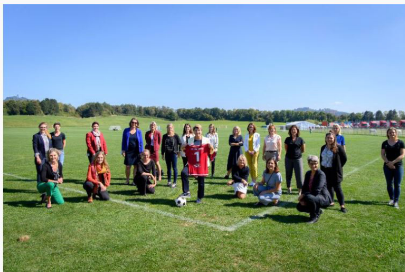
Rencontre inaugurale du FC Helvetia en septembre 2020

L'équipe de football féminin du Parlement suisse, le FC Helvetia , a été mise sur pied en septembre 2020. La promotion du sport et du football féminins ainsi que des échanges entre les parlementaires et la population est l'un des objectifs du FC Helvetia. L'amusement, l'amitié et le fair-play sont également des éléments centraux pour le FC Helvetia. Une unité d'entraînement et un match par session parlementaire sont prévus. Le premier match doit avoir lieu en été 2021 contre la Croix-Rouge suisse. Swiss Olympic assume l'administration du club dans le cadre de la gestion du secrétariat pour l'Intergroupe parlementaire Sport.