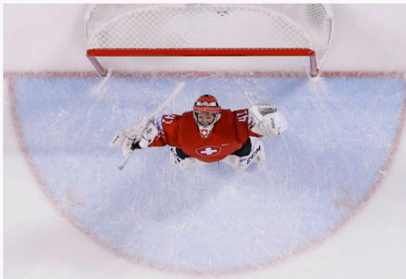
Florence Schelling, Winter Olympic Games 2018

En été 2020, Swiss Olympic a lancé la série des Dialogues Swiss Olympic . Six personnalités ont abordé le thème « Les femmes cadres dans le sport » à l'occasion de la première édition de cet événement, le 27 août à la Maison du Sport à Ittigen. Les participants ont notamment mis en avant l'immense potentiel des femmes cadres dans le sport. En 2021, d'autres discussions sur des thématiques sportives d'importance sociale auront lieu dans le cadre des Dialogues Swiss Olympic.