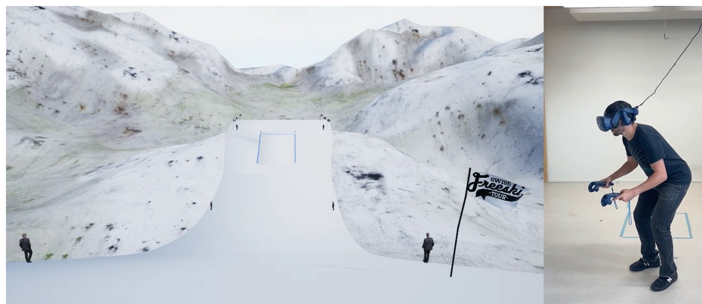
Abb. 2: Virtuelle Simulation der Sprungaufgabe. Optische und akustische Informationen erlaubten den Rückschluss auf die Windbedingungen.

Untersuchungsgruppe: 16 männliche Freeski-Athleten zwischen 10 und 22 Jahren wurden in zwei Erfahrungsgruppen unterteilt. Die Expertengruppe hatte Swiss Olympic Cards National bis Silber ( n = 5 , Alter = 18.6 \pm 2.7 Jahre, in Leistungskader seit 5.8 \pm 1.6 Jahre). Die Nachwuchsgruppe ( n = 11 , Alter = 12.9 \pm 1.4 Jahre, in Leistungskader seit 2.3 \pm .9 Jahre) hatte lokale oder regionale Swiss Olympic Talent Cards. Studiendesign: Bei der experimentellen Laborstudie wurden Sprünge über einen Kicker bei verschiedenen Windsituationen virtuell simuliert. Die physikalischen Bedingungen und der Sprung wurden den realen Bedingungen des Corvatsch WC-Course nachempfunden. Der Pop wurde mittels Kraftmessplatte gemessen. Die Expertiseunterschiede der DZZ gaben Aussagen zur FWKE und dem Fertigkeitstransfer. Datenanalyse: Mehrfaktorielle Varianzanalysen mit Messwiederholung wurden angewendet, um Unterschiede innerhalb der Versuchsperson, zwischen den Erfahrungsgruppen und dem Interaktionseffekt der Windsituation und der Erfahrung zu untersuchen.